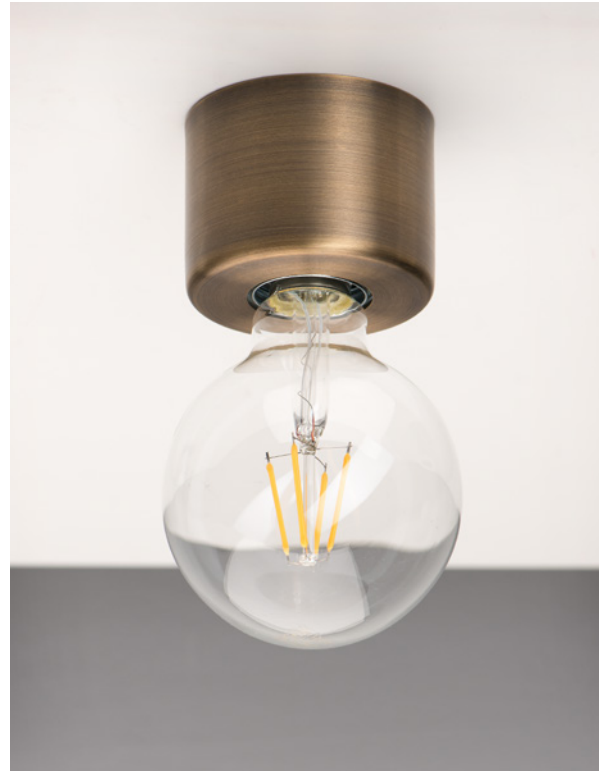
Beispielhafte Darstellung mit Leuchtmittel